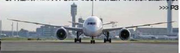
国、荷主、業界全体での議論や取り組みが求められる

国際航空貨物輸送のセキュリティ確保と物流円滑化を目的とするノンシッパー(特定荷主=KS)/レギュレーテッドエージェント(特定航空貨物利用運送事業者など=RA)制度での貨物検査が厳格化する。安全性が確認されているKS以外の貨物は、フォワーダーを中心としたRAまたは航空会社・上層会社などが爆発物検査を行っているが、今年3月から検査対象がカートン単位に拡大するほか来年1月からは貨物の「中身」の安全確認まで求められる。現在は外装で爆検を行っている。全量開披での安全確認は現実的ではなく、X線検査装置での爆検が求められる。荷主は非KSが大半を占めており、業界全体での対応が課題になる。>>> P3